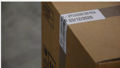
APLICACIÓN DE PLIEGUE A 90°

Los Eticode 600-700-1000 están diseñados y fabricados íntegramente por Topjet. Todos los componentes se prueban y comprueban durante el montaje. La eficacia de nuestros sistemas de "impresión y aplicación" queda demostrada por las numerosas aplicaciones industriales acumuladas a lo largo de 30 años.