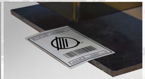
APLICACIÓN DE LA BANDERA