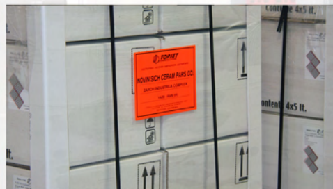
APLICACIÓN EN UN PALET DE FORMATO A5